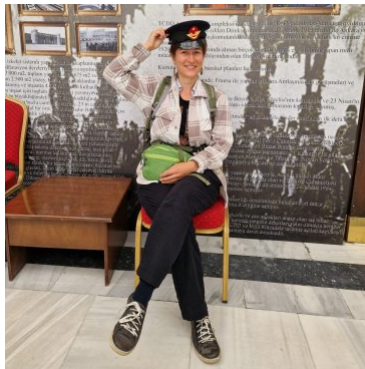
Sarah (Reise auf dem Landweg)

Hüseyin wurde in Diyarbakir geboren, wuchs dort auf und zog schließlich zum Tourismusstudium nach Antalya und Kastamonu. Sein besonderes Interesse im Studium galt dem Übergang der Menschheit zur Sesshaftigkeit und der Mythologie dieser Zeit. Seit 2019 leitet Hüseyin Reisen durch die ganze Türkei, auf dem Balkan und in Georgien, wobei das Schwarze Meer und das Hinterland zu seinen Lieblingsregionen zählen. Er freut sich besonders darauf, die Gruppe mit seinem geschichtlichen Wissen, seinem politischen Interesse und seinem Können an der Saz - der türkischen Langhalslaute - inhaltlich wie musikalisch auf unserer Reise durch die Nordost-Türkei zu begleiten.