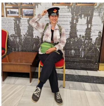
Sarah (Reise auf dem Landweg)

Hüseyin wurde in Diyarbakir geboren, wuchs dort auf und zog schließlich zum Tourismusstudium nach Antalya und Kastamonu. Sein besonderes Interesse im Studium galt dem Übergang der Menschheit zur Sesshaftigkeit und der Mythologie dieser Zeit. Seit 2019 leitet Hüseyin Reisen durch die ganze Türkei, auf dem Balkan und in Georgien, wobei das Schwarze Meer und das Hinterland zu seinen Lieblingsregionen zählen. Er freut sich besonders darauf, die Gruppe mit seinem geschichtlichen Wissen, seinem politischen Interesse und seinem Können an der Saz - der türkischen Langhalslaute - inhaltlich wie musikalisch auf unserer Reise durch die Nordost-Türkei zu begleiten.